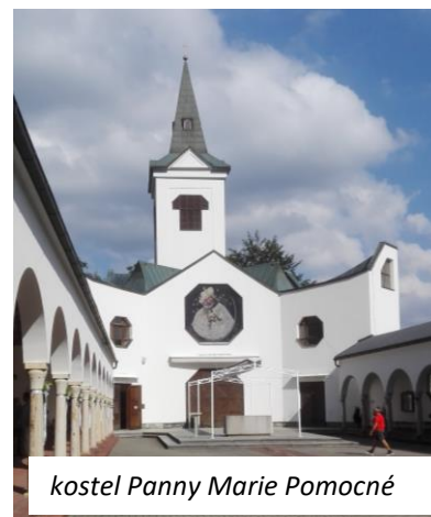
kostel Panny Marie Pomocné

Přestože jsou Zlaté Hory malé poklidné městečko uprostřed zalesněných kopců, najdete zde i kulturní vyžití. Během léta se zde konají městské slavnosti Zlaté dny , kde můžete zažít koncerty známých českých či slovenských kapel. Bohatý program nabízí i samotné Sanatorium Edel, v parku za léčebnou bývají o víkendech akce „ Za Edel “, tedy koncerty menších hudebních kapel, letní kino, loutkové divadlo pro děti nebo třeba kurzy jógy.